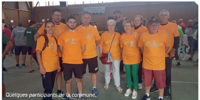
Quelques participants de la commune.