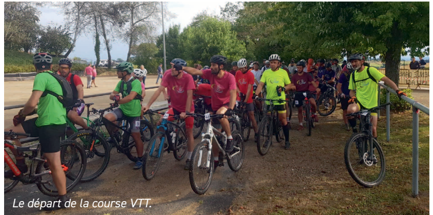
Le départ de la course VTT.