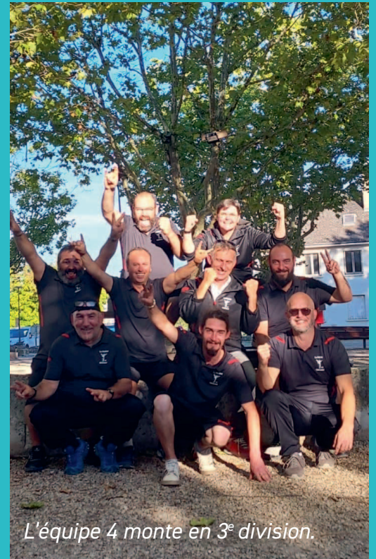
L'équipe 4 monte en 3 e division.

Rendez-vous est donné pour les concours de belote qui se déroulent le 4 e vendredi de chaque mois.