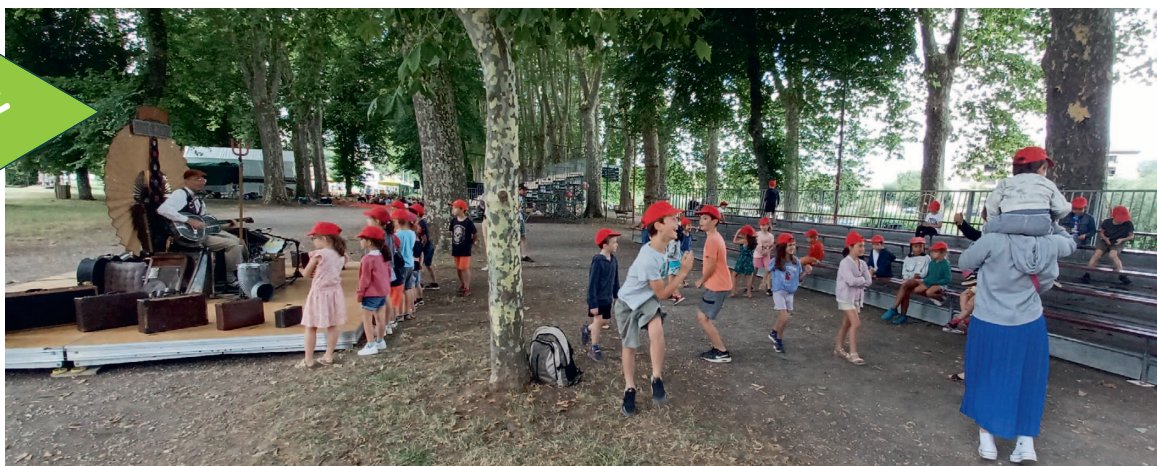
Danse autour d'un homme-orchestre à Cap Mômes.

L'ACM "Loulous et Terreurs" a proposé cet été un programme riche en activités menées dans un esprit ludique et éducatif. Aux vacances d'Automne, ils viendront frapper à vos portes pour Halloween.