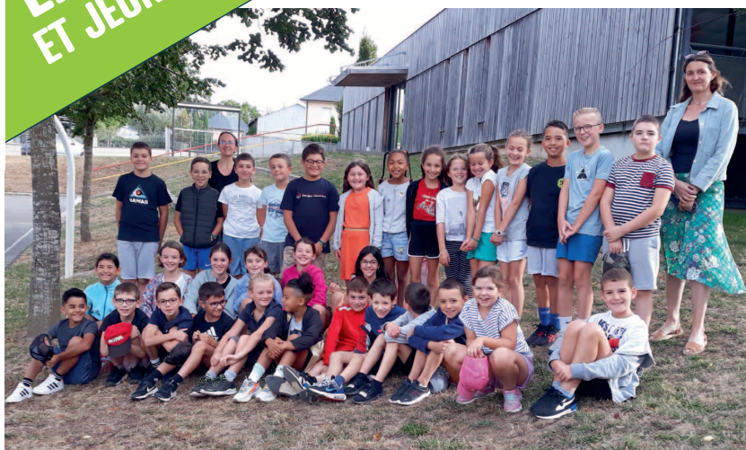
La rentrée des classes.