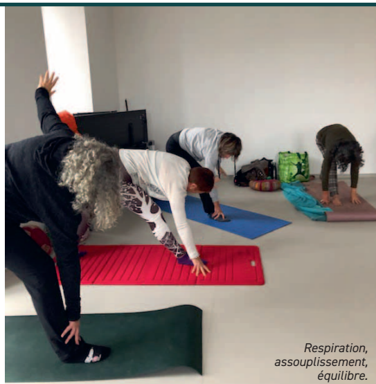
Respiration, assouplissement, équilibre.