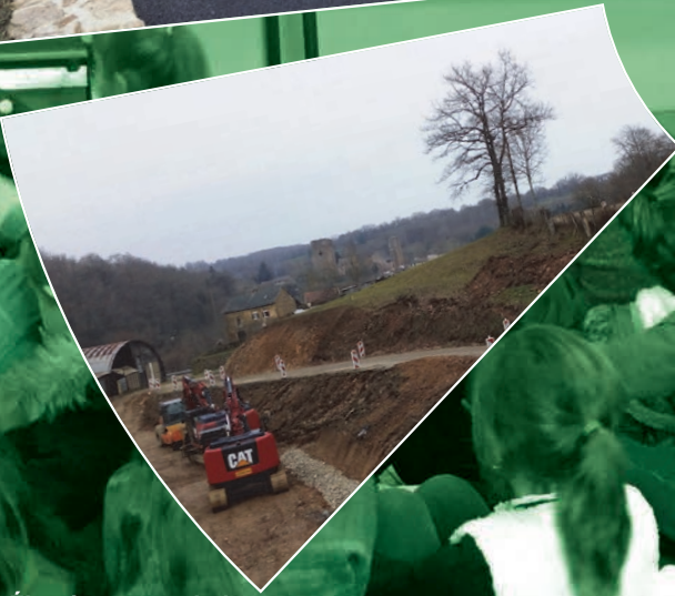
Élargissement de la Route Départementale au Caussanel (en amont du village de Calmont)