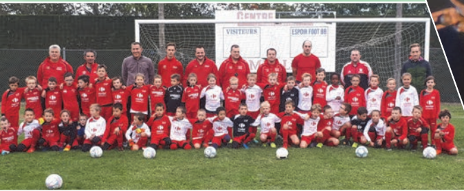
L'équipe des U9 d'EFC88