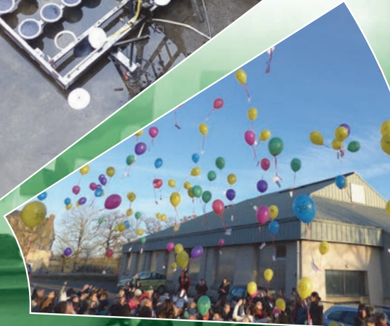
Un envol de ballons lors du Téléthon