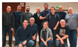
Les responsables des différents comités de la commune

Ce fut une belle année 2019 pour le comité. Une belle fête de juillet, des animations ponctuelles appréciées et un beau projet de maison pour les habitants qui avance aussi bien que nous l'espérons! Les architectes sont au travail. 170 personnes ont répondu à l'enquête