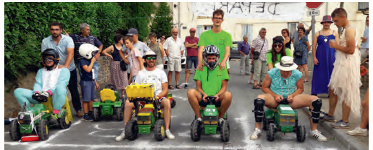
La course de tracteurs à pédales!