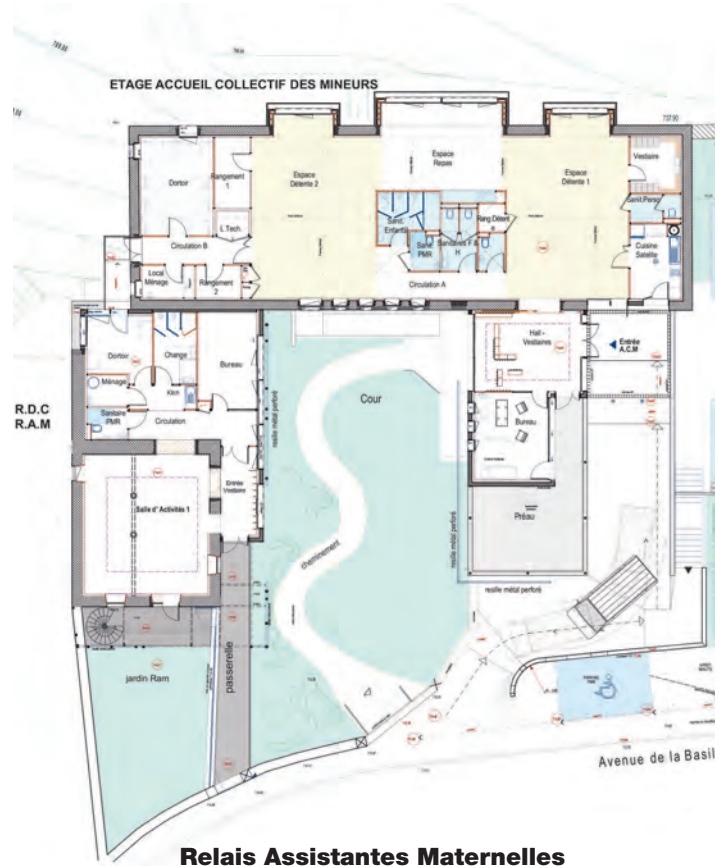
Relais Assistantes Maternelles