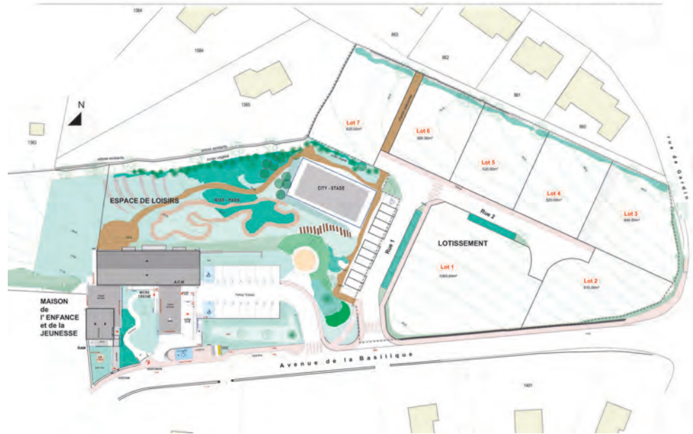
Plan d'aménagement d'ensemble

- En ce qui concerne l'aménagement de la Maison Enfance Jeunesse, le projet est porté par la communauté de communes. Le permis de construire est en cours d'instruction, la consultation d'entreprises vient d'être lancée ainsi que les demandes de subventions. En fonction des réponses des partenaires financiers (Etat, CAF, Région, Département...) les travaux devraient pouvoir commencer début 2020.