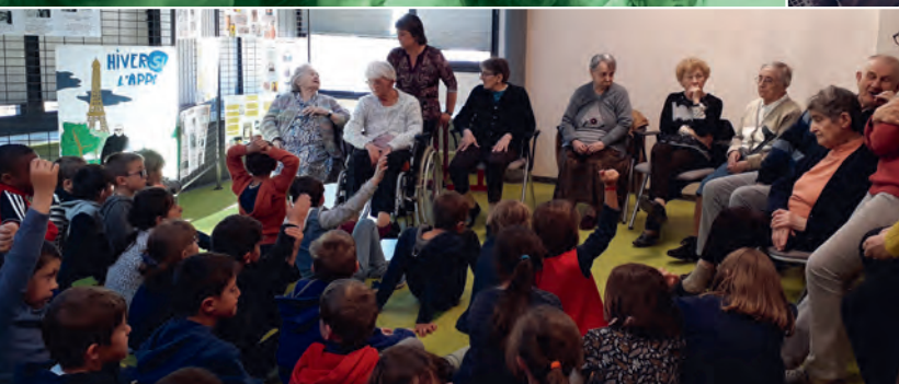
Une rencontre intergénérationnelle autour des années 50 à la Médiathèque (résidents de l'EHPAD Sainte Marthe et enfants des écoles de la Commune)

Vie communale Vie scolaire Portrait Vie associative Informations pratiques