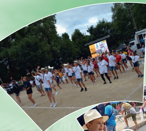
Le championnat de France individuel de Quilles de Huit à Magrin le 11 août

La nouvelle façade de l'école publique La Nauze à Ceignac. Les travaux se termineront aux vacances de Toussaint