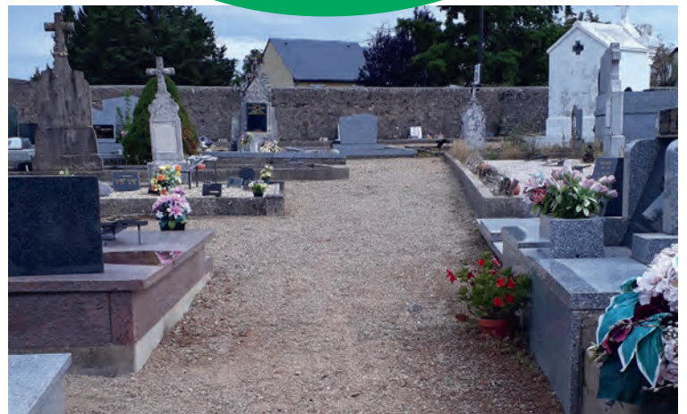
L'allée d'un cimetière après l'intervention du Service Technique Municipal

La propreté de nos cimetières dépend aussi de chacun de nous! Facilitons le nettoyage des employés de la Commune en arrachant régulièrement les herbes indésirables poussant aux plus proches abords de la concession N.B. : les plantations directes devant les concessions sont interdites.