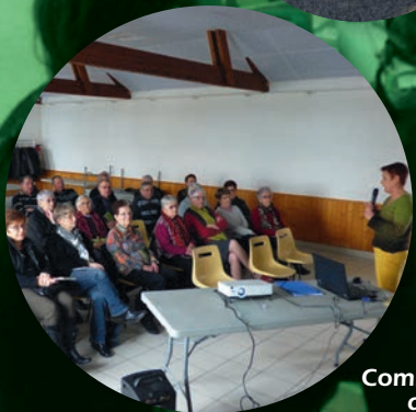
Intervention d'une diététicienne auprès des aînés, le 7 février