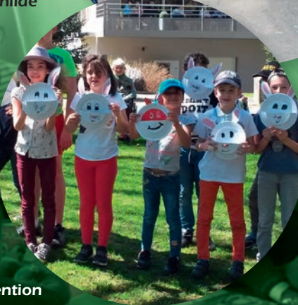
Les "paniers lapins" pour la chasse à l'œuf avec les Maisons de retraite de Ceignac