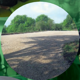
Le nouveau parking près du terrain de quilles (Magrin)