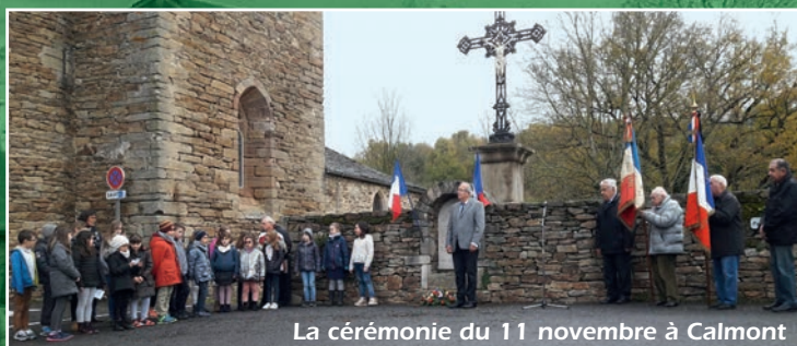
La cérémonie du 11 novembre à Calmont

Vie Communale Portrait Vie Scolaire Vie associative État civil Informations pratiques