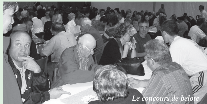
Le concours de belote

Tout d'abord, le concours de belote du vendredi soir a vu affluer pas moins de 90 équipes. Les gagnantes (5034 pts) sont reparties chacune avec un beau jambon et de bonnes bouteilles ; 49 autres équipes ont également été récompensées.