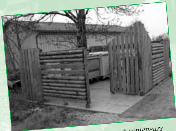
L'aménagement d'un espace à conteneurs à Prévinquières.