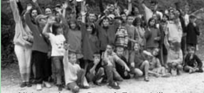
Mini-camp dans les Gorges du Tarn en juillet 2007