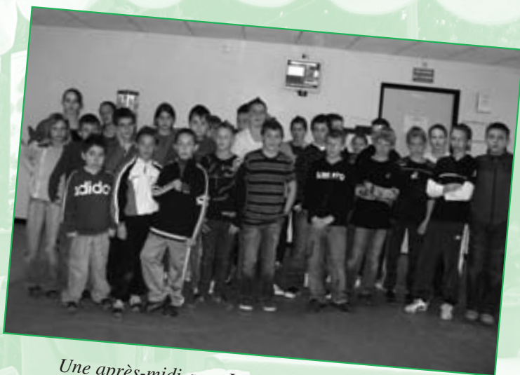
Une après-midi au « Laser Games » de Bel-Air, organisée par le Conseil Municipal d'Enfants.