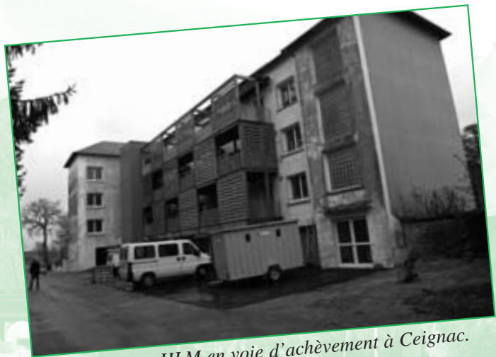
11 logements HLM en voie d'achèvement à Ceignac.