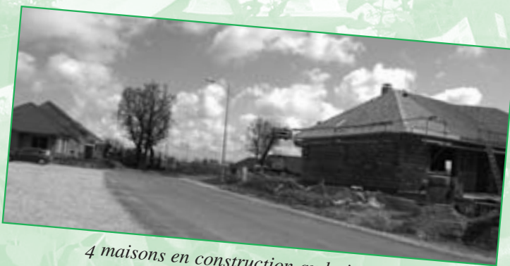
4 maisons en construction au lotissement « Les Chênes » à Ceignac.