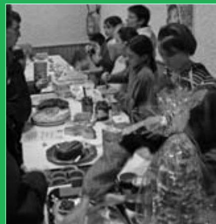
Vente de gâteaux et confiseries par le Conseil Municipal d'Enfants