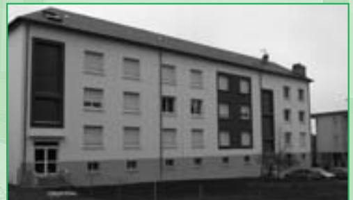
Réalisation de 11 logements H.L.M. à Ceignac