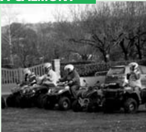
Balade en quad à travers la Commune ...Et aussi : Concours de belote