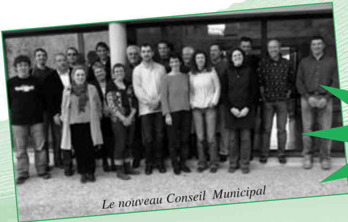
Le nouveau Conseil Municipal