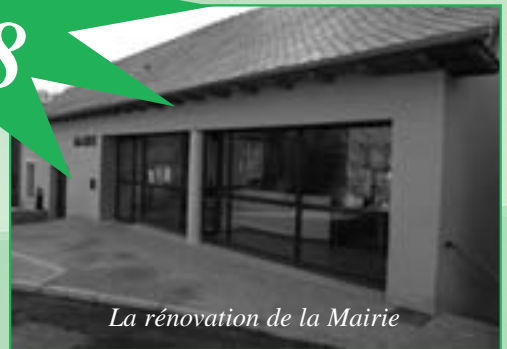
La rénovation de la Mairie