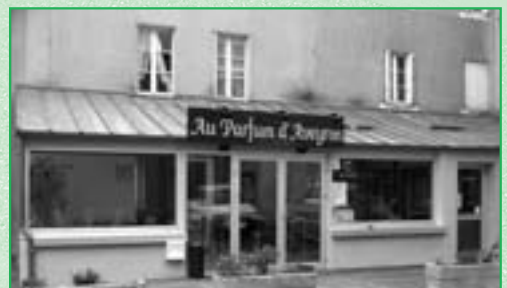
Un nouveau restaurant dans la Commune