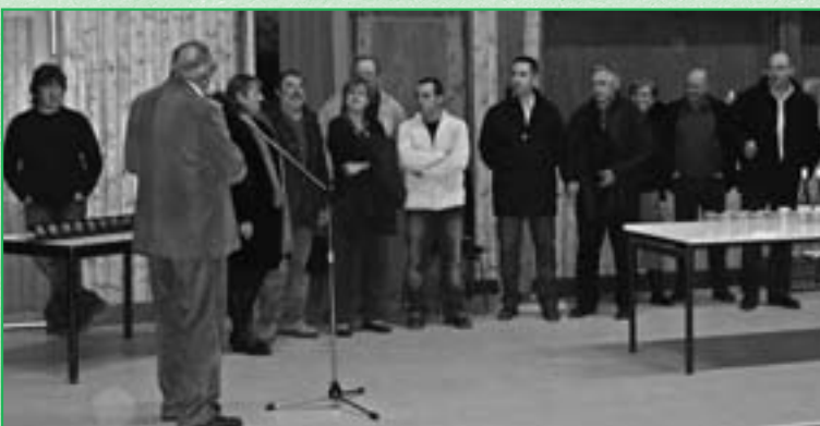
Les anciens élus à l'honneur