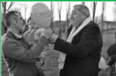
Le traditionnel lâcher de ballons