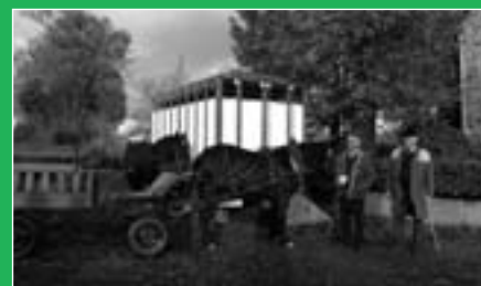
Prêts pour une promenade en calèche ? ...Et aussi : course des enfants.