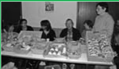
Marché de Noël organisé par l'E.S.A.T. de Ceignac