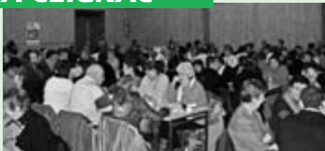
Le quine ...Et aussi : Randonnée VTT, déjeuner aux tripous