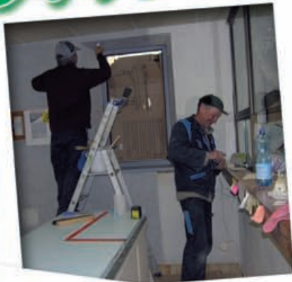
Les employés municipaux « relookent » l'Agence Postale Communale.