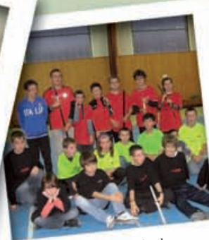
... et lors du tournoi de hockey.