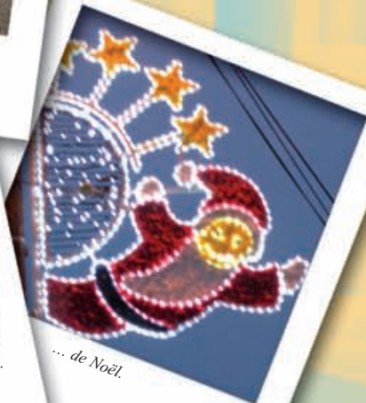
... de Noël.