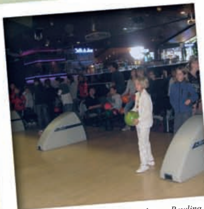
Les ados au Bowling...