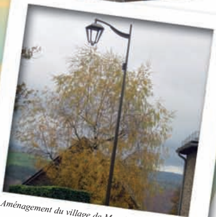
Aménagement du village de Magrin.