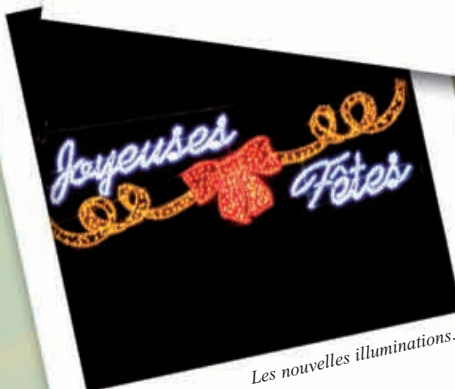
Les nouvelles illuminations...