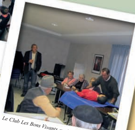
Le Club Les Bons Vivants en Assemblée Générale.