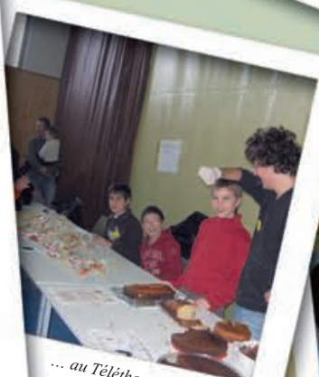
... au Téléthon...