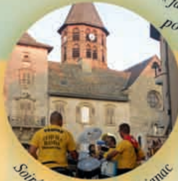
Soirée Apéro-Bandas à Ceignac