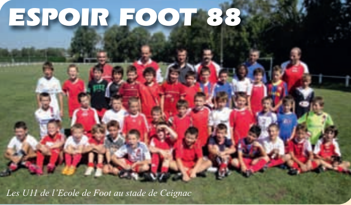
Les U11 de l'Ecole de Foot au stade de Ceignac

Le club d'ESPOIR FOOT 88 est né en 2005 de la fusion de l'école de foot (fondée en 1990) et des clubs Séniors des communes de Baraqueville, Calmont, Manhac et Sainte-Juliette.