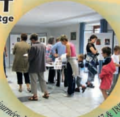
Les journées du Patrimoine à Calmont (17 & 18/09/11)