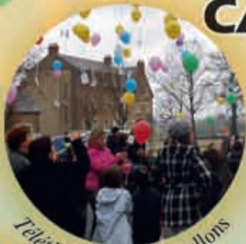
Téléthon : le lâcher de ballons