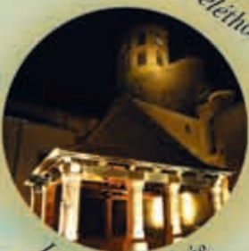
La Halle illuminée