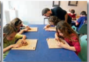
Atelier du Musée