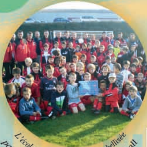
L'école de foot Espoir Foot 88 labellisée par la Fédération Française de Football