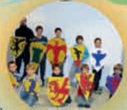
Atelier « fabrication de boucliers » pour les jeunes