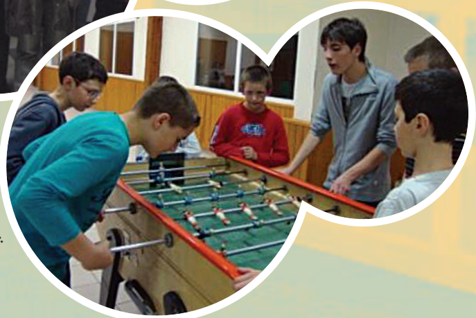
Partie de Baby foot pour les jeunes de la Commune.