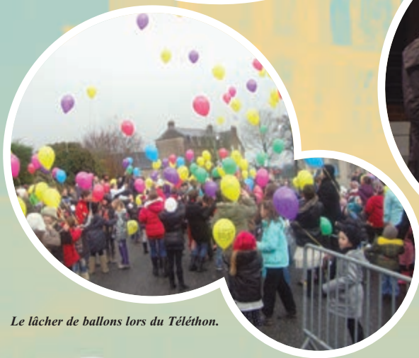
Le lâcher de ballons lors du Téléthon.