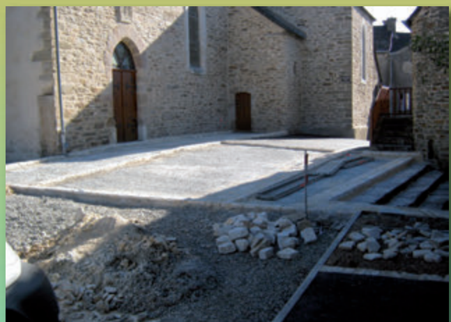
Le parvis de l'église en cours d'aménagement