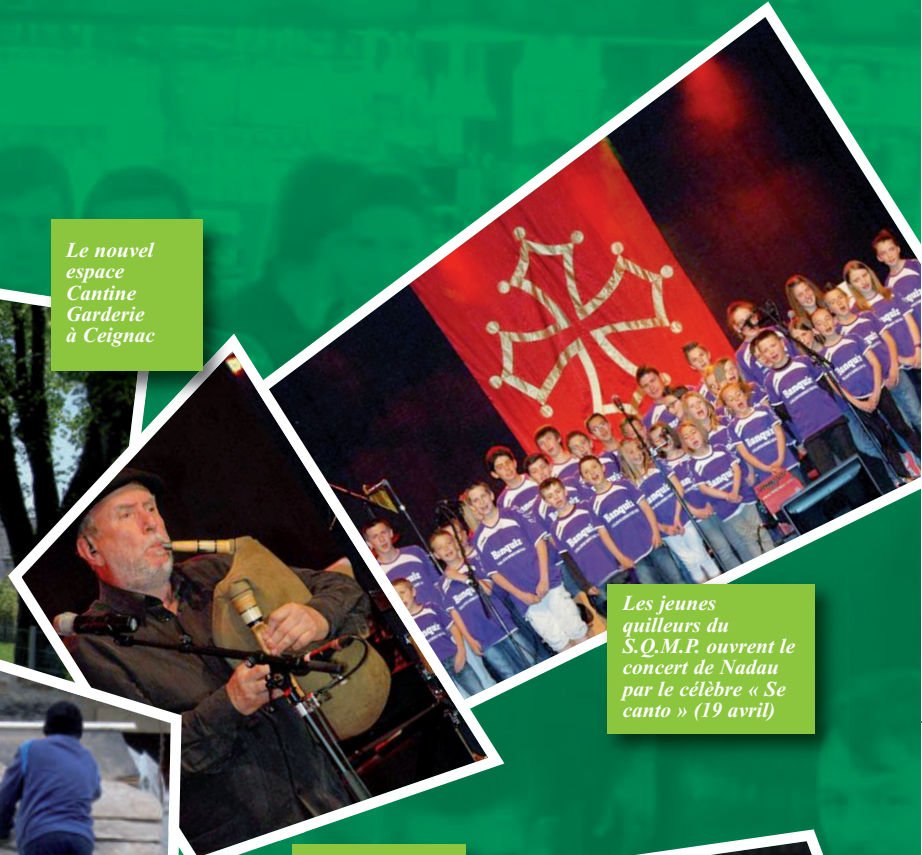
Les jeunes quilleurs du S.Q.M.P. ouvrent le concert de Nadau par le célèbre « Se canto » (19 avril)