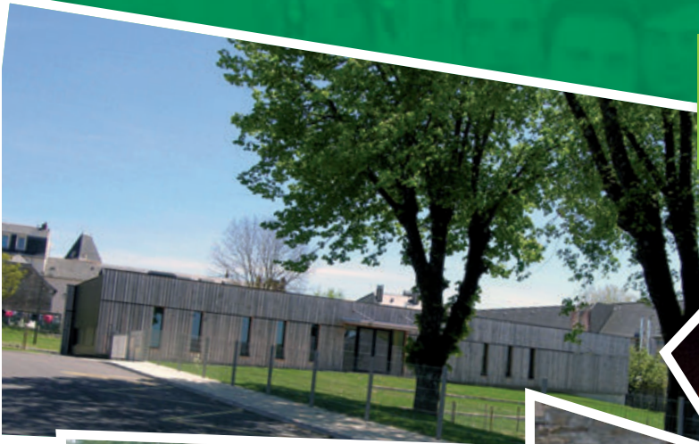
Le nouvel espace Cantine Garderie à Ceignac