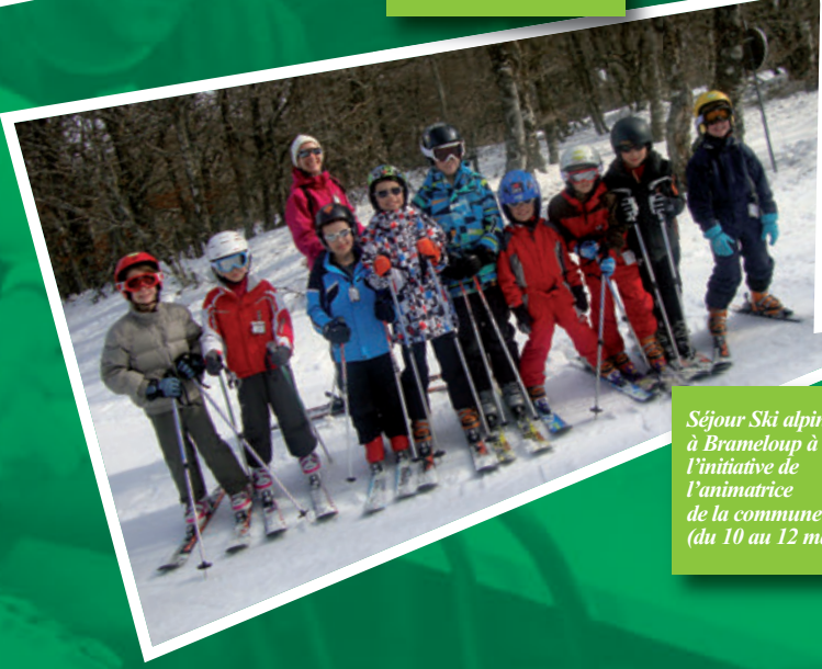
Séjour Ski alpin à Brameloup à l'initiative de l'animatrice de la commune (du 10 au 12 mars)