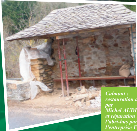
Calmont : restauration du puits par Michel AUDIBERT et réparation de l'abri-bus par l'entreprise FASTRÉ