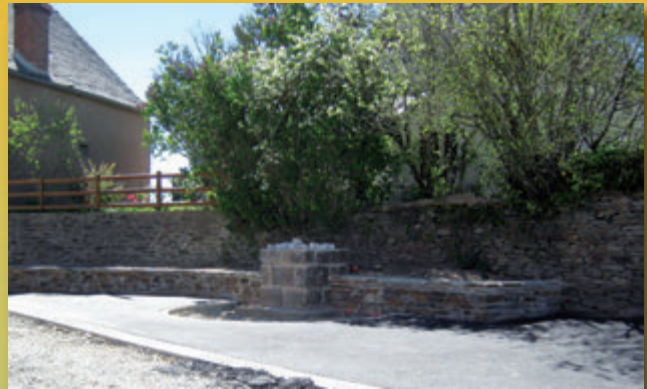
Le futur monument aux morts

Le chantier sera entièrement finalisé d'ici cet été. ■