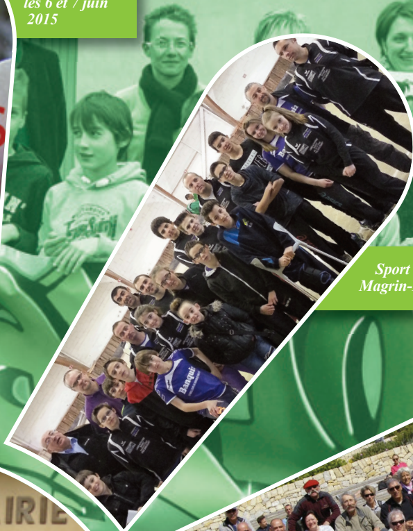
Sport Quilles Magrin-Parlan