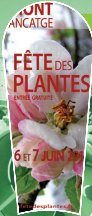
Fête des plantes les 6 et 7 juin 2015