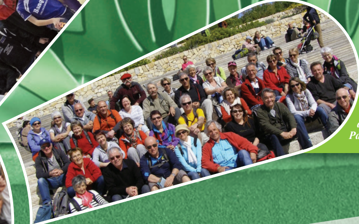
Les randonneurs des 4 clochers au royaume de Pagnol !