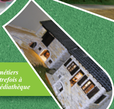
Les métiers d'autrefois à la Médiathèque