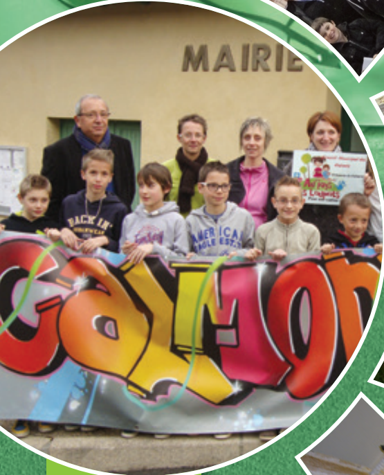
Le Conseil Municipal d'Enfants remet un chèque à l'Associa- tion « Au pays des Loupiots »