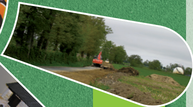
Elargissement de la Route Départementale 603