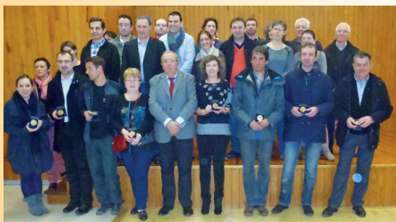
Remise de la médaille communale aux anciens conseillers municipaux lors de la cérémonie des vœux le 10 janvier