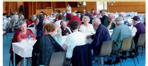
Goûter offert aux bénéficiaires

Le Service de Soins infirmiers à domicile est géré par l'ADMR et couvre les mêmes communes.